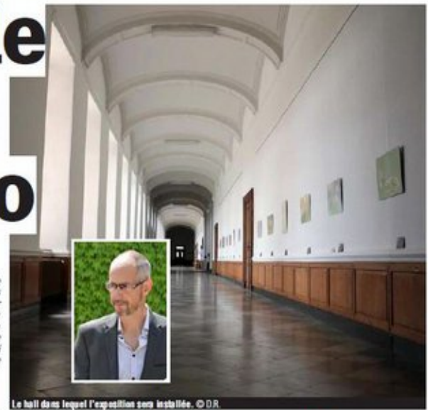
Le hall dans lequel l'exposition sera installée.

Afin de présenter aux visiteurs ce formidable parcours dans le passé, les organisateurs ont eu l'idée de monter leur exposition en offrant différentes portes d'entrées. « La découverte complète de la ligne du temps nécessitera peut-être plusieurs visites. Le visiteur pourra néanmoins lire cette ligne du temps de différentes manières, en partant par exemple une période donnée, en ne se pen-